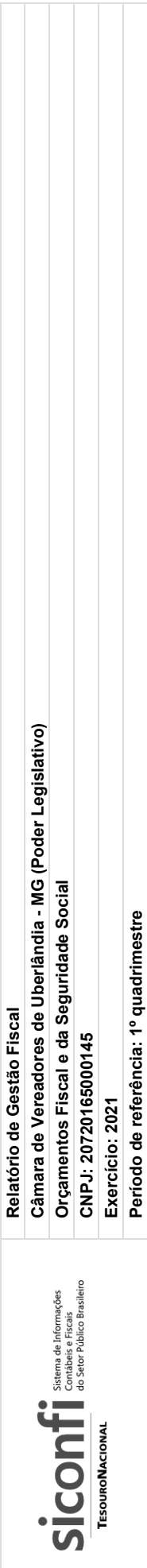
RGF-Anexo 01 | Tabela 1.0 - Demonstrativo da Despesa com Pessoal