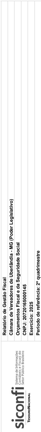
RGF-Anexo 01 | Tabela 1.2 - Trajetória de Retorno ao Limite da Despesa Total com Pessoal